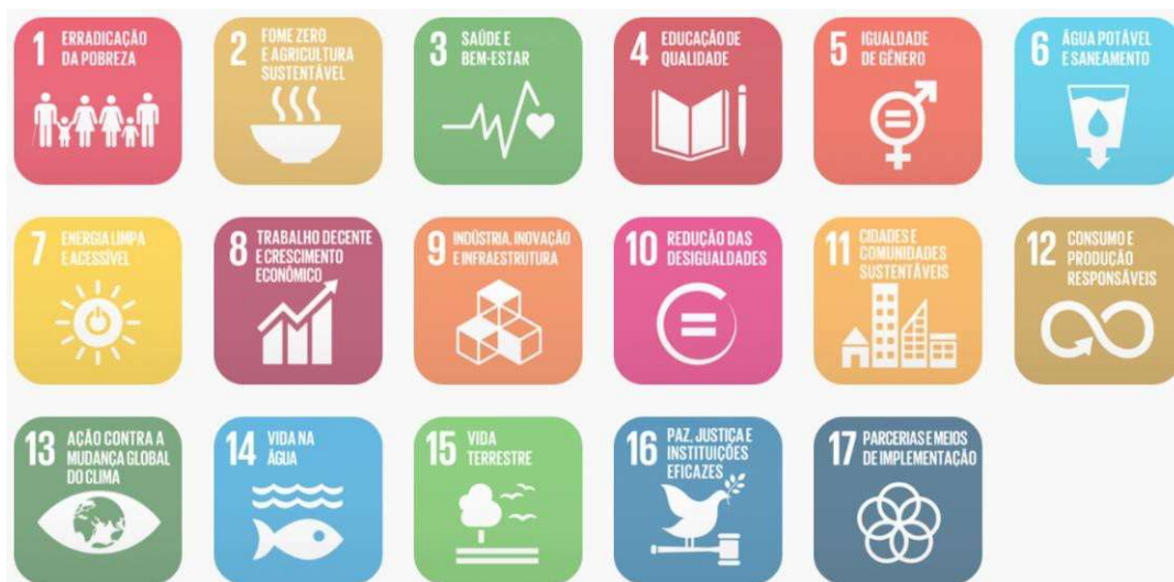
Figura 02: Objetivos de Desenvolvimento Sustentável